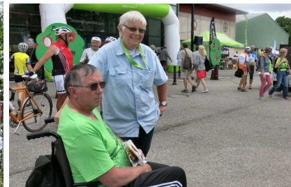
Début août, à la Semaine fédérale de Mortagne-au-Perche

Plus d'infos sur le site Internet du CoReg : http://paysdelaloire.ffct.org