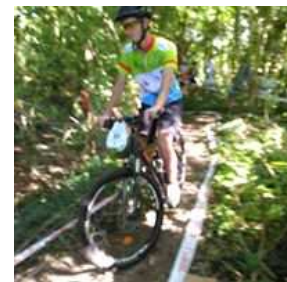
Échos de la Semaine jeunes 2017 à Châtellerauld