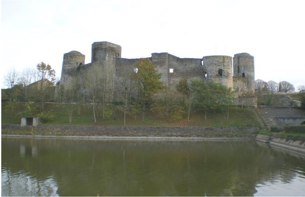
Le Château Fort de Pouancé